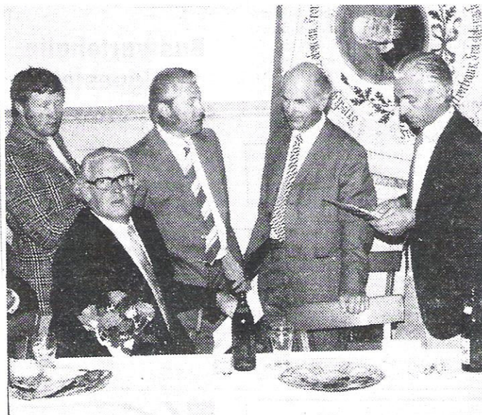
Landrat Franz Baier (2. v. l.) begrüßte bei der Besprechung für den geplanten Bau der Sporthalle in Ostheim das Vorhaben und sicherte seine Unterstützung zu.

Bau der Halle eingeplant sind, verringerten sich die Kosten zusätzlich. Mit einer Ausnahme (Malsfeld) unterstützten sämtliche Bürgermeister aus den Ortsteilen der zukünftigen Großgemeinde das Vorhaben und befürworteten den baldigen Baubeginn. Landrat Baier begrüßte die Initiative und den Einsatz und betonte, daß bisher in dieser Form im Kreis Melsungen noch keine Sporthalle entstanden sei. Unter diesen günstigen Voraussetzungen, sagte Baier, sichere er seine volle Unterstützung zu. Noch auftretende Schwierigkeiten müßten gemeinsam schnellstens überwunden werden. Die vorgelegten Pläne sollten baldmöglichst eingereicht werden, schloß Baier abschließend vor.