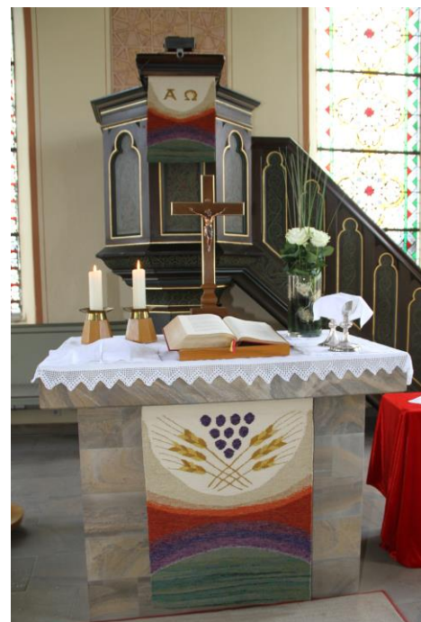
Altar im 21. Jahrhundert