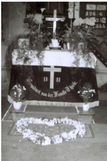
Altar im 19. Jahrhundert