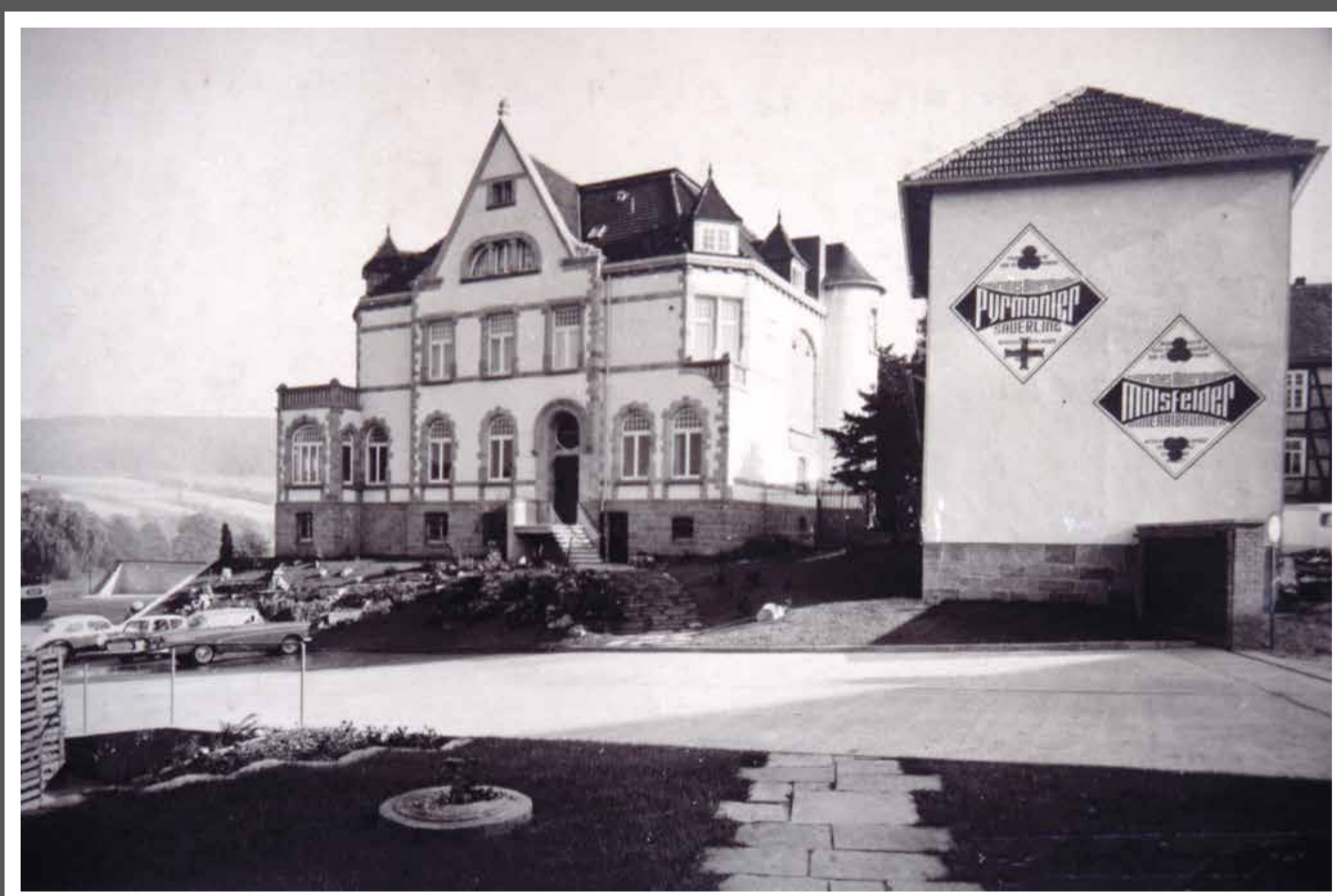
Von 1960 bis 1970 wurde in den Gebäuden des Ritterguts „Malsfelder Mineralbrunnen“ aus einer Quelle im Elsegrund abgefüllt.

Bis in die 1. Hälfte des 19. Jahrhunderts leben die Malsfelder Bürger überwiegend von Ackerbau, Viehzucht und Leinweberei. Mit der Anbindung an das Schienennetz 1848 ergaben sich neue wirtschaftliche Möglichkeiten. Später entstanden erste Industriebetriebe wie Bergbau, Brauerei, Mineralbrunnen. Auch gab es ein vielfältiges Angebot in Handwerk, Handel und Dienstleistung.