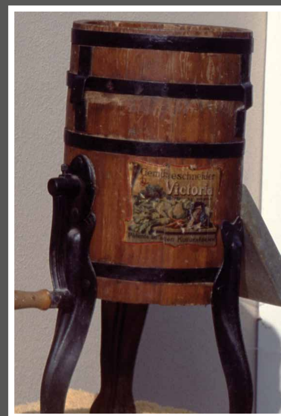
Der Krauthobel Victoria aus Malsfeld wurde um die Jahrhundertwende hergestellt und bis nach Amerika und Rußland exportiert.