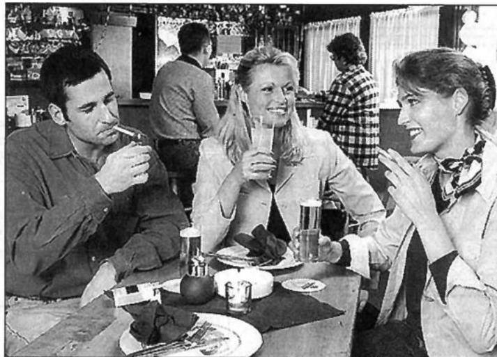
Auch wenn jeder die Gesundheitsrisiken kennt, fällt es den meisten Rauchern schwer, auf die „Zigarette danach“ zu verzichten.

■ Wählen Sie eine günstige Zeit. So können ein Urlaub oder die Zeit nach einer Erkrankung, bei der Sie sowieso nicht geraucht haben, ideale Ausgangspunkte zum Abgewöhnen sein.