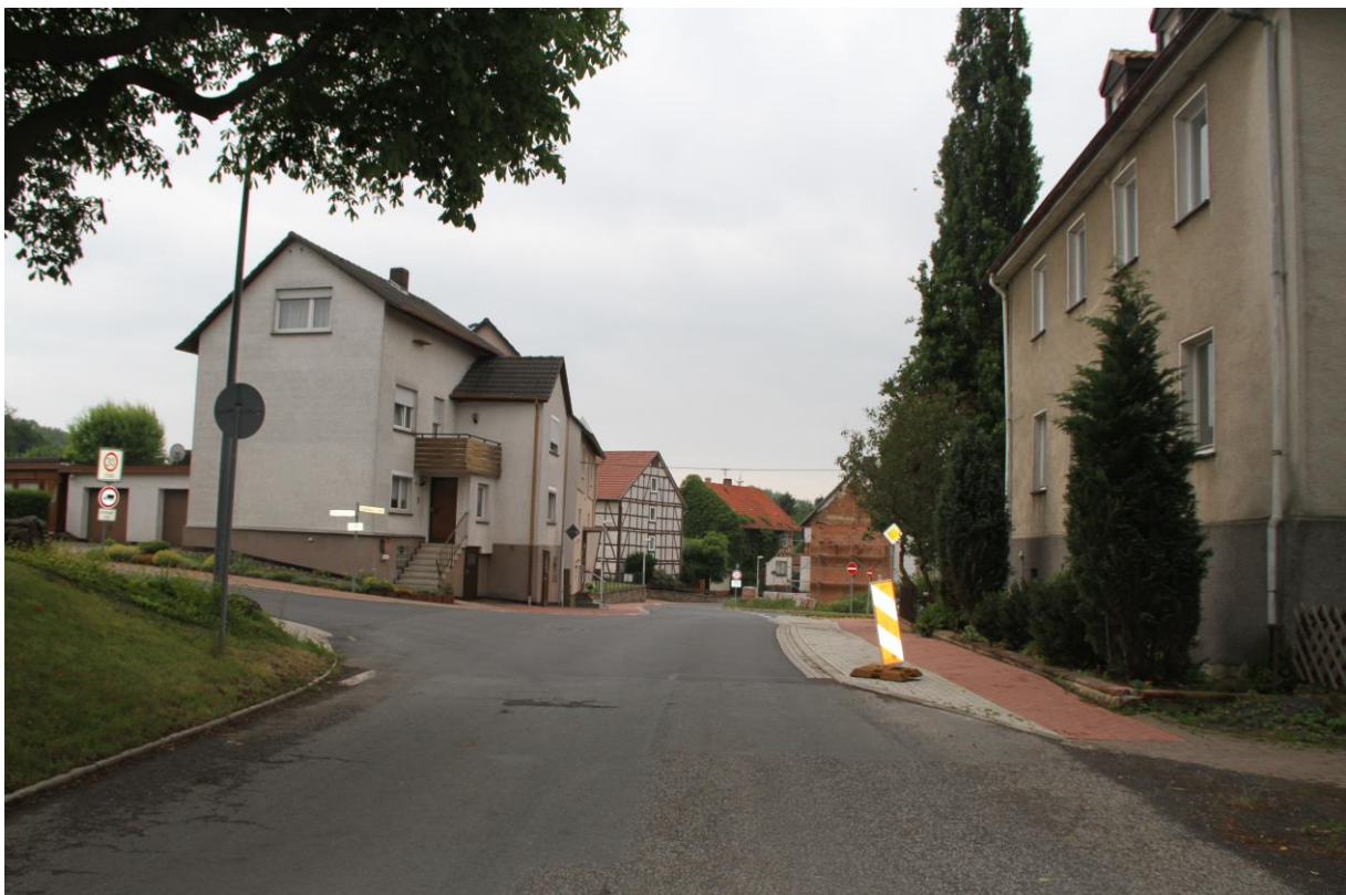
Straßenansicht „Sipperhäuser Straße“