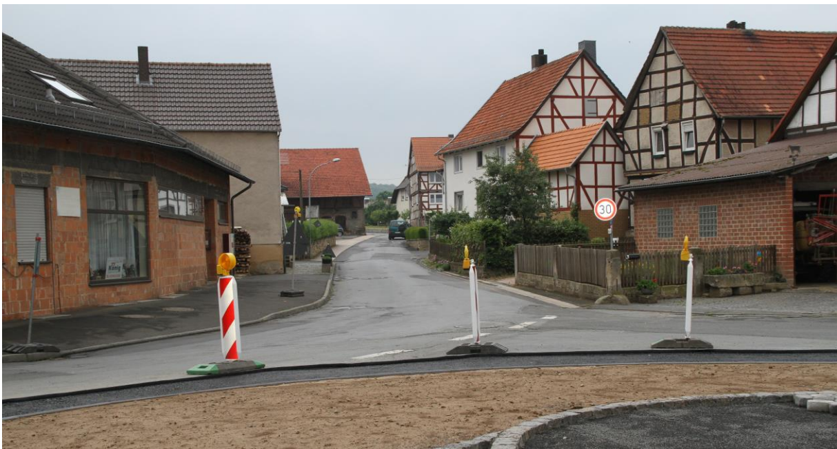
Straßenansicht „Mosheimer Straße“