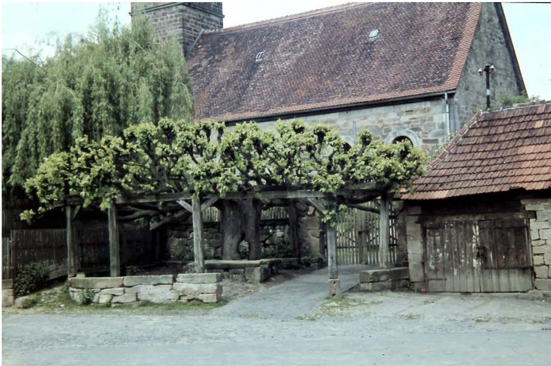
Unsere Kirche mit dem zwischenzeitlich abgerissenen Dorf-Backhaus