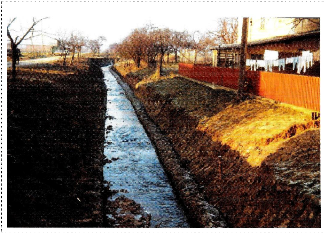
Rhünda am Bruchweg