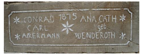
Inscription der Scheune