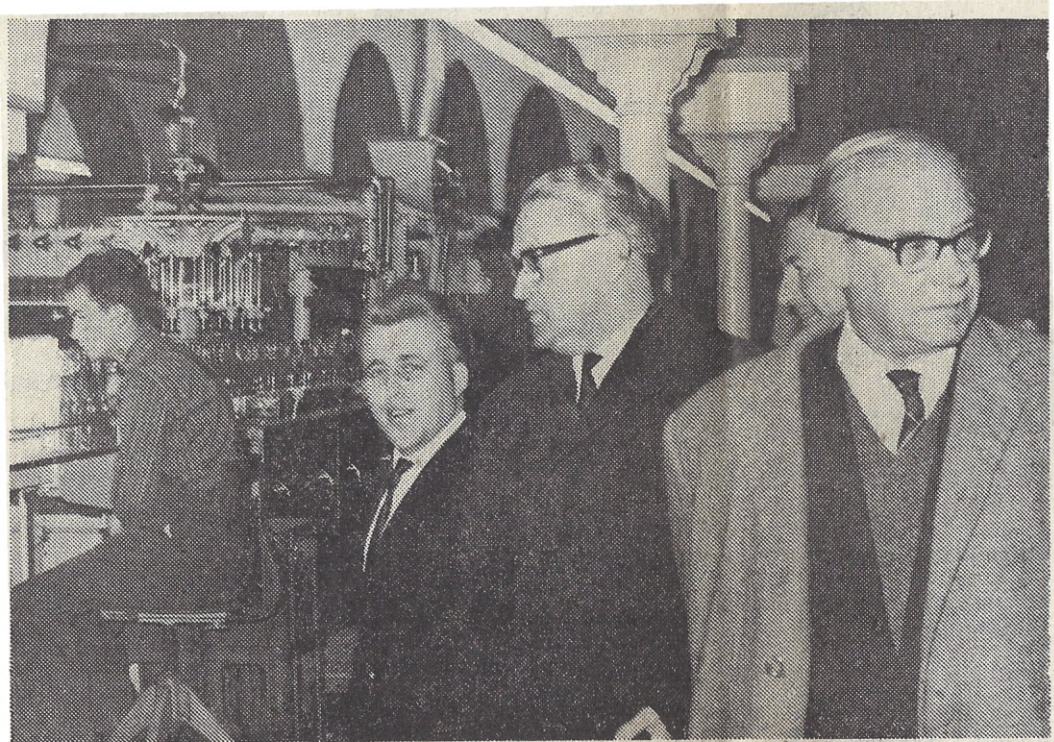
Bis Ende der 60er Jahre wurde das Malsfelder Mineralwasser kommerziell genutzt. Die Abfüllanlagen waren in den ehemaligen Stallungen des leerstehenden Rittergutes untergebracht. Unser Foto aus der damaligen Zeit zeigt den verstorbenen hessischen Ministerpräsidenten Georg-August Zinn sowie den damaligen Landrat Franz Baier und Bürgermeister Kurt Stöhr bei einer Besichtigung.