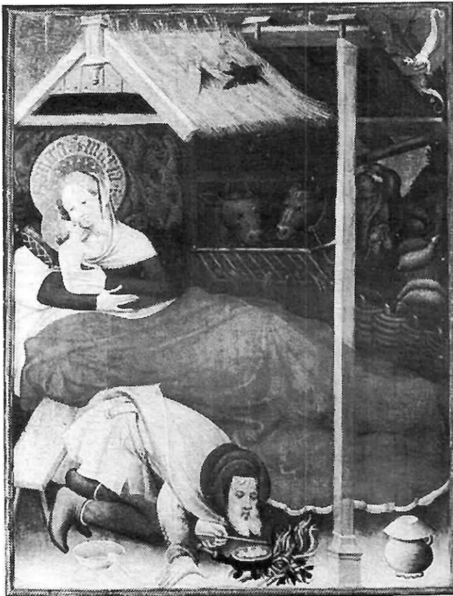
Die Geburt des Heilands - Teilstück aus dem berühmten Altargemälde des Meisters Conrad von Soest in der Evangelischen Stadtkirche zu Bad Wildungen.

Ich glaube jedoch, daß das schon früher so war und wohl auch in Zukunft so bleiben wird.