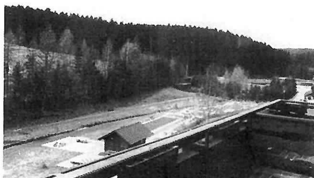
Blick vom Balkon auf den nahegelegenen Wald

Nach den Wanderungen unterhält Sie in unserer Pils- und Weinstube bei Schrammelmusik der „lustige Zitherspieler“.