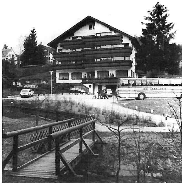
Wo der (gezähmte) Wildbach rauscht ...

Unsere Küche hat Tradition und bietet Abwechslung - probieren Sie es aus! Vollpension DM 44,00, Halb-Pens. DM 40,00, Übernachtung mit Frühstück DM 33,00 + 0,60 DM Kurtaxe.