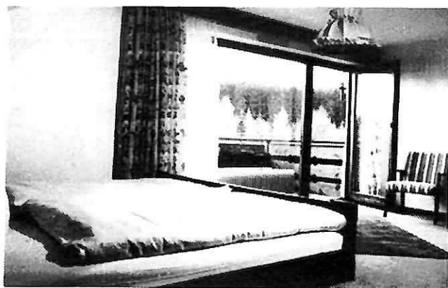
Hier lässt sich's gut ruhn.

7244 Waldachtal-Lützenhardt, Breitenbachstraße · Tel. 0 74 43 / 80 16