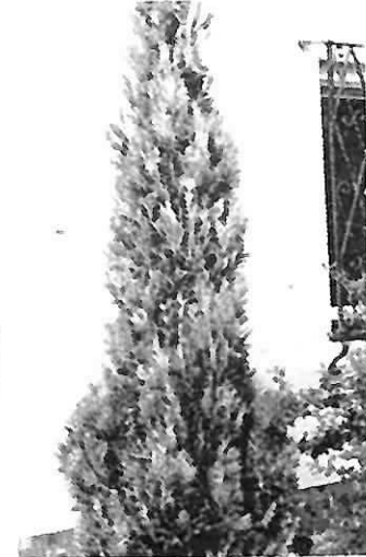
Chamap. laws. 'Columnaris glauca' Blaue Säulen- Scheinzypresse 40/60 cm