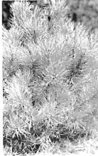
Pinus montana mughus Krummholzkiefer 25/30 cm