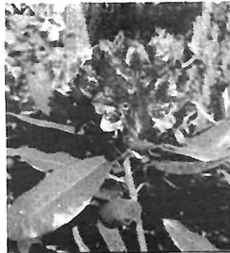
Rhododendron versch. Farb. 60/70 cm