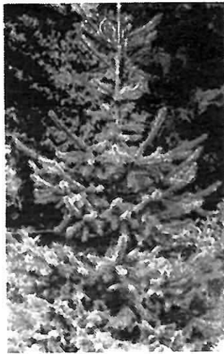
Picea omorika Serbische Fichte 60/80 cm