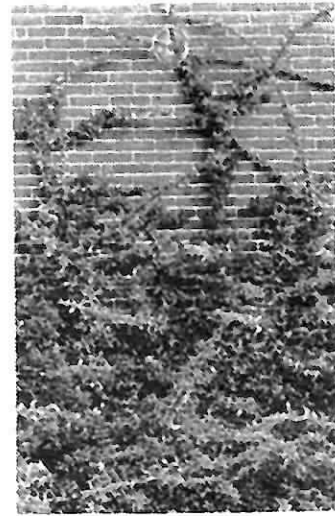
Feuerdorn »Orange Glow« 100/120 cm mit Beeren