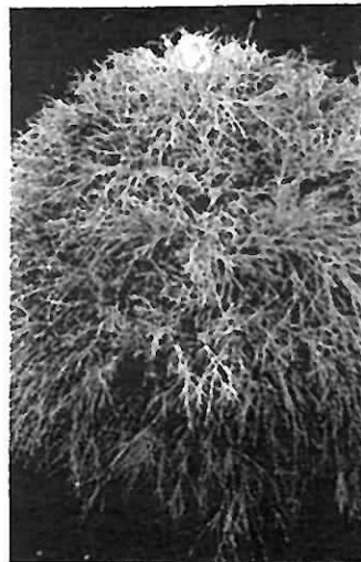
Chamap. pis. 'Filifera Nana' Haarzyypresse 40/60 cm