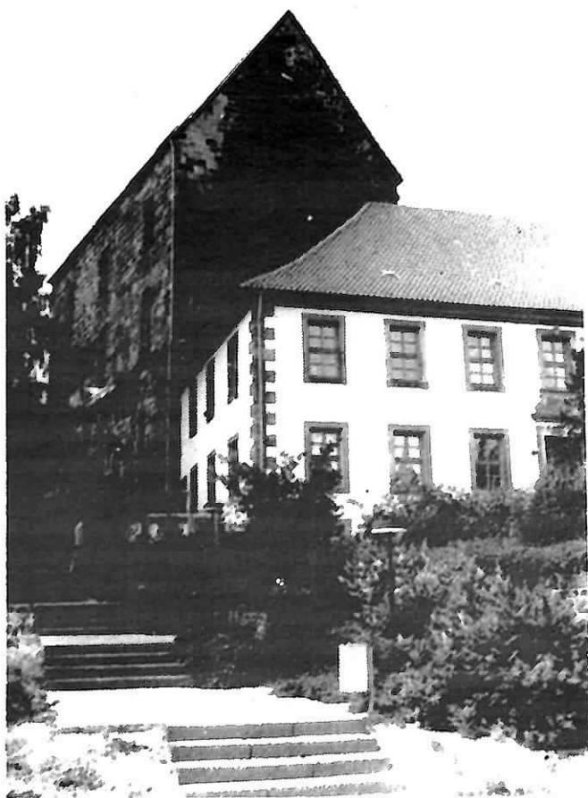
Muthaus (Haus des Gastes)

Heimat- und Unterhaltungsabende, Konzerte, Farb-Dia-Vorträge, Lagerfeuerabende, geführte Wanderungen zum Erwerb des Solling-Wanderabzeichen, Bus- und Ausflugsfahrten durch den Solling, in den Harz und an die Weser