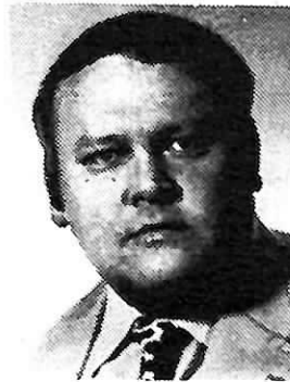
Beratung bei LBS-Bezirksleiter:

Mit der LBS und dem 624-Mark-Gesetz schaffen Sie sich den Grundstein für die erste eigene Wohnung.