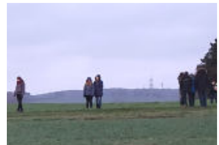
Sonnenaufgang am Fährberg Ostern 2021

Abendmahlsgottesdienste wird es am Ostermontag um 9.00 Uhr in Elfershausen und um 10.30 Uhr in Beiseförth geben.