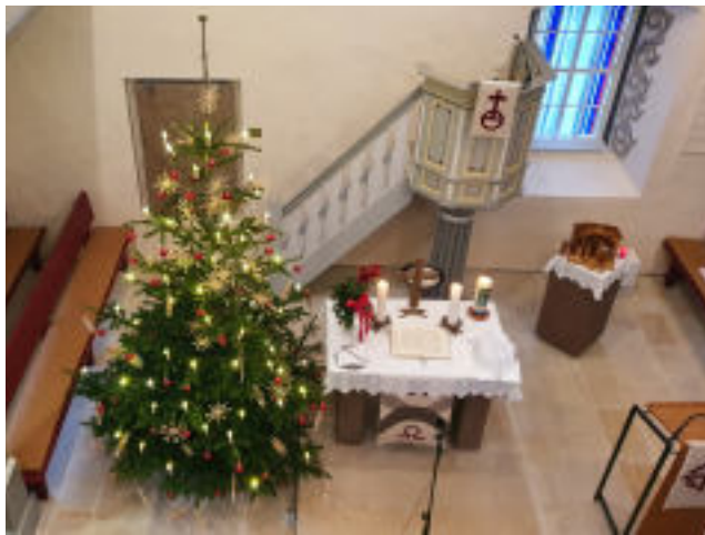
Weihnachten 2021, Kirche Elfershausen