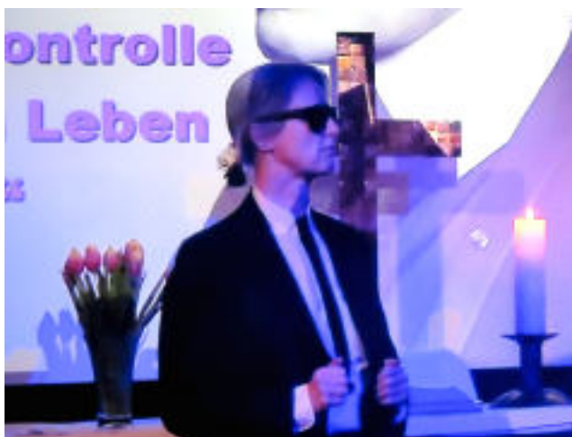
Kreuz&Quer-Gottesdienst "Schräge Typen": Karl Lagerfeld