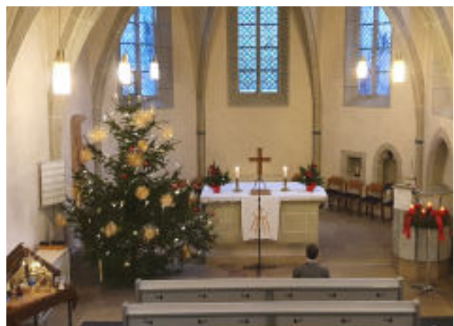
Weihnachten 2021, Kirche Dagobertshausen