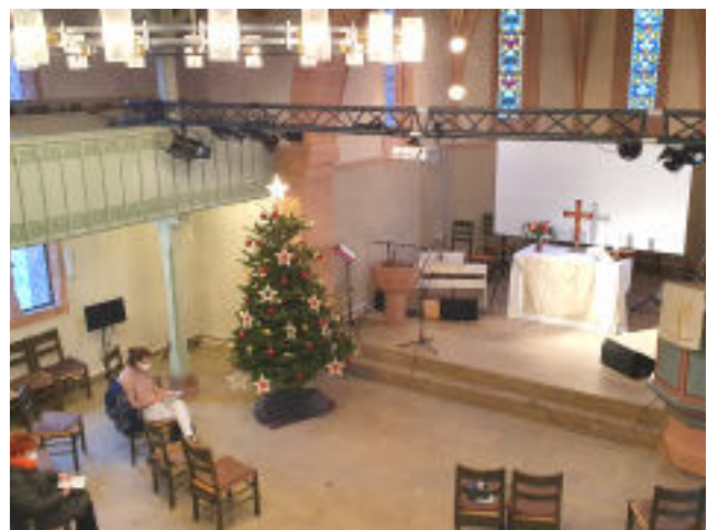
Weihnachten 2021, Kirche Malsfeld