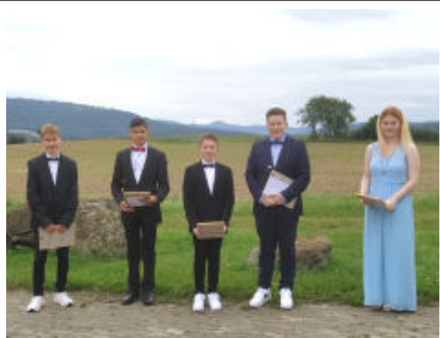
Konfirmation II am 19.09.2021