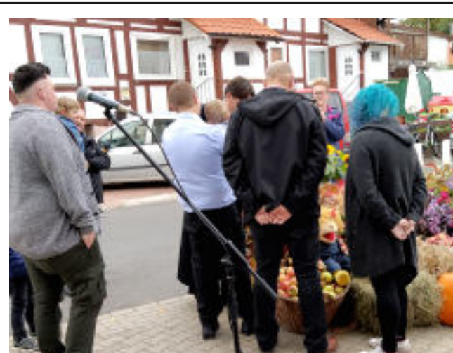
Taufe auf dem Erntedankfest