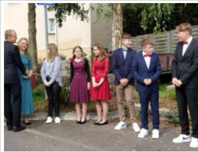
Konfirmation I am 12.09.2021