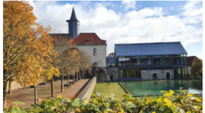
Blick auf die Klosterkirche und das Konvent (Die Bäume deuten das frühere Kirchenschiff an.)

schaft wieder neu entdeckt und mit Hilfe von vielen Fördermitteln und Spenden in den heutigen gut ausgestatteten, vielfältig nutzbaren Zustand versetzt. Dazu gehört u.a. die wiederaufgebaute Klosterkirche, Unterkünfte, Tagungsräume und der von der EXPO in Hannover bekannte „Christus-Pavillon“, der in Volkenroda wiederaufgebaut wurde und seitdem für die Gottesdienste genutzt wird. Dieser Raum beeindruckt besonders durch seine immense Höhe, durch seine Lichtverhältnisse und die faszinierende Akustik. Die künstlerische Gestaltung des „Würfels“ regt außerdem gezielt das Nachdenken über die Probleme unserer Zeit in Verbindung mit dem christlichen Glauben an.