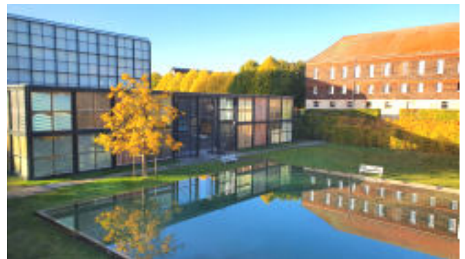
Blick auf den Christus-Pavillon und das Langhaus

schaft wieder neu entdeckt und mit Hilfe von vielen Fördermitteln und Spenden in den heutigen gut ausgestatteten, vielfältig nutzbaren Zustand versetzt. Dazu gehört u.a. die wiederaufgebaute Klosterkirche, Unterkünfte, Tagungsräume und der von der EXPO in Hannover bekannte „Christus-Pavillon“, der in Volkenroda wiederaufgebaut wurde und seitdem für die Gottesdienste genutzt wird. Dieser Raum beeindruckt besonders durch seine immense Höhe, durch seine Lichtverhältnisse und die faszinierende Akustik. Die künstlerische Gestaltung des „Würfels“ regt außerdem gezielt das Nachdenken über die Probleme unserer Zeit in Verbindung mit dem christlichen Glauben an.