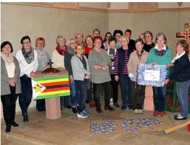
Weltgebetstag am 05. März in Malsfeld (das Bild entstand noch vor der Corona-Pandemie)