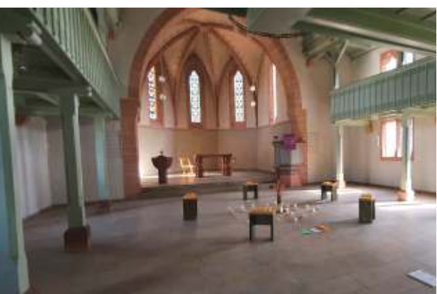
Mit den "offenen Kirchen" laden wir ein zur Stille, zum Gebet, zur Andacht. In der Malsfelder Kirche werden in unregelmäßigen Abständen immer wieder neue Gebetsstationen gestaltet.