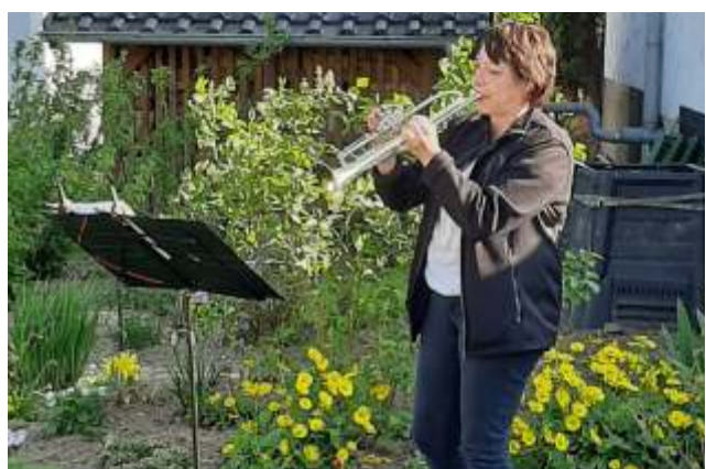
Stellvertretend für viele musizierende Menschen, die besonders in den Wochen der Kontaktsperre für Trost und Ermutigung mit Ihren Liedern sorgten.