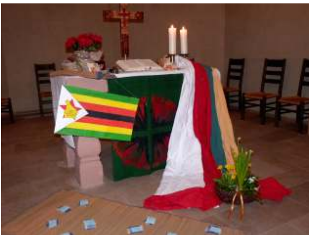
Gastgeberland des diesjährigen Weltgebetstages 2020 war Simbabwe