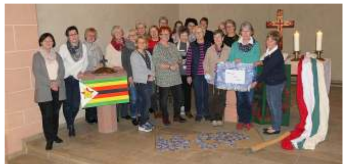
Arbeiteten zum ersten Mal in dieser Konstellation zusammen: Das Weltgebetstags-Team des Kirchspiels Beiseförth-Malsfeld, Dagobertshausen und Elfershausen