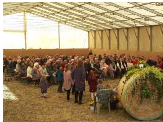
Erntedank-Fest auf Hof Dethof am 30. September 2018