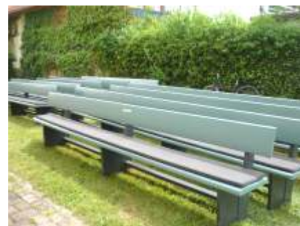
Die Kirchenbänke der Beiseförther Kirche benötigen einen neuen Anstrich. Oben sehen Sie die Bänke nachdem diese aus der Kirche getragen wurden.