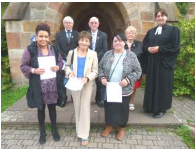
Jubiläumskonfirmation Malsfeld am 09.09.18 Diamantene + Goldene Jubilare