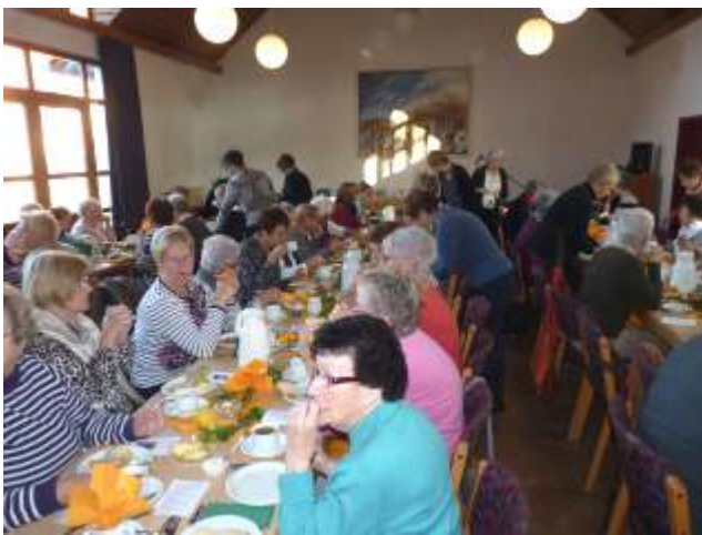
Frauenfrühstück am 03. November 2018