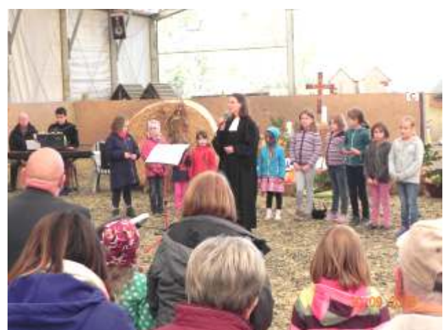
Erntedank-Fest auf dem Hof Dethof am 30. September 2018