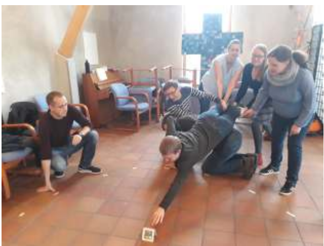
Familienfreizeit auf dem Kirchberghof vom 01. - 03. Oktober 2018