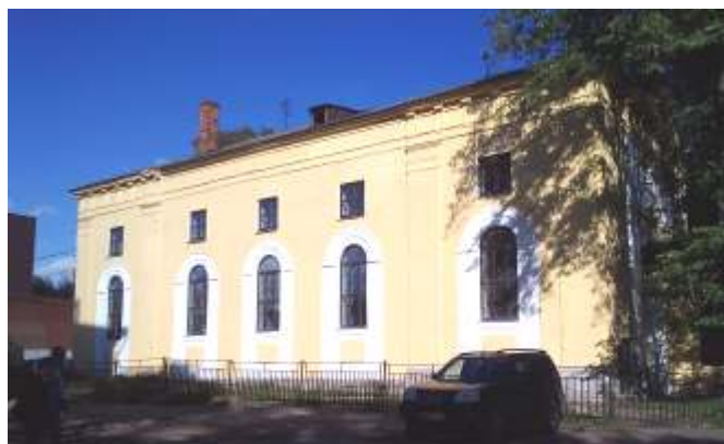
Das renovierte Kirchengebäude der lutherischen Gemeinde in Jaroslavl

Auf der Internetseite der Evangelisch-Lutherischen Kirche Russlands heißt es u.a.: