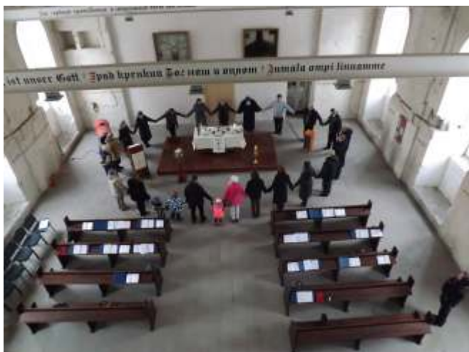
Oster-Gottesdienst in der lutherischen Kirche in Jaroslavl

Nicht nur Spaß hat es gemacht – helfen konnten wir mit unserem Gemeindefest im August 2018 auch noch: 634,12€ konnten wir als Erlös an den Verein für den Wiederaufbau der luth. Kirche in Jaroslavl weiterleiten. Es ist ein kleiner Betrag dazu, dass die evangelisch-lutherischen Christen in Jaroslavl ihre Kirche weiter sanieren können.