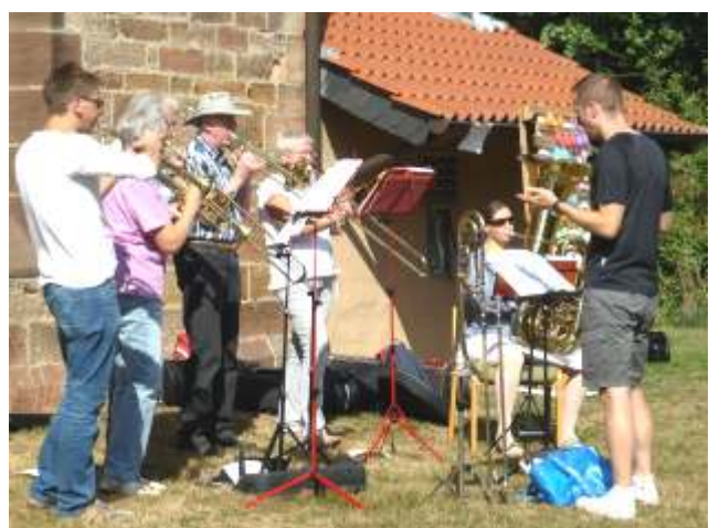
"Spürbar Sonntag" und Gemeindefest am 26.08.'18