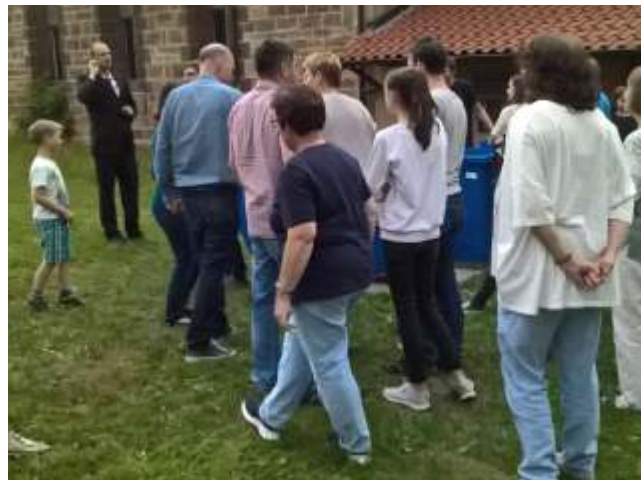
Mitarbeiter*innenfest am 15.06.'18