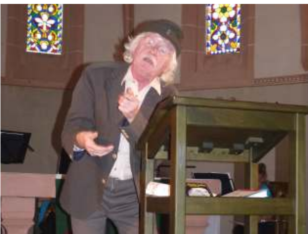
"Innse Kirche" Justus Riemenschneider u.a. am 17.08.'18