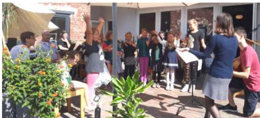
Kinderchor beim Sommerfest des Vereins Praktischer Lebenshilfe

Wie bisher findet der Gottesdienst am Sonntag ebenfalls im Wintergarten statt. Die Termine und Zeiten entnehmen Sie bitte dem Beiblatt im Gemeindebrief. Auch dazu herzliche Einladung .