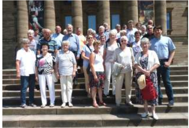
Gemeindefahrt nach KS-Wilhelmshöhe am 20.06.'18 (Gruppe vor der Gemäldegalerie/Schloss)