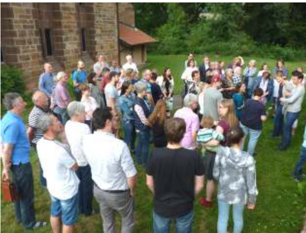
Mitarbeiter*innenfest am 15.06.'18