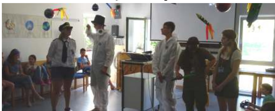
Bild oben: Gruppenfoto mit allen Teilnehmer*innen und Mitarbeiter*innen

ten, um von den dortigen Bewohnern wichtige Dinge für die Menschheit zu lernen. Dabei ging es um Themen wie Mut, Vorurteile, Arm und Reich oder Gebet.