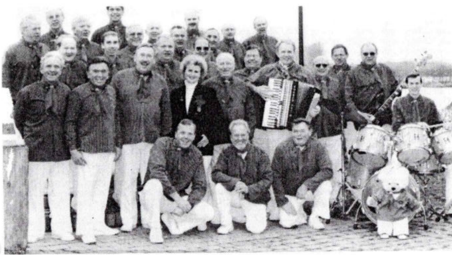
Der Shanty-Chor aus Einbeck singt morgen zum Festkommers anlässlich des Vereinsjubiläums der Dagobertshäuser Schützen. Gefeiert wird gleichzeitig das Kreisschützenfest.