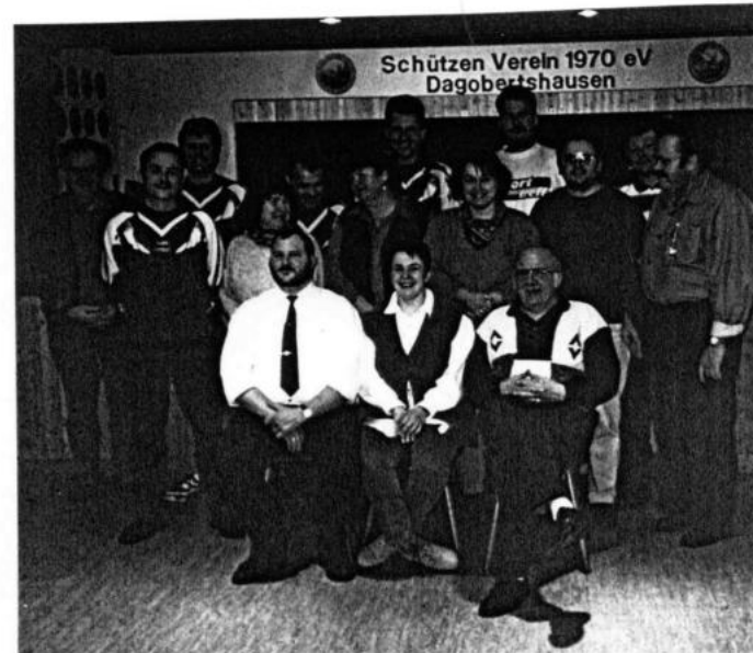
Der neugewählte Vorstand